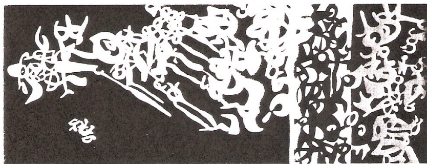
Nella foto a sinistra Carla Accardi "Vi labirinto con settori", 1957 acrilico su tela - cm 75 x 200